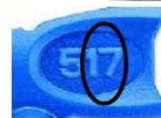
Рекомендуемые сопла для нанесения RE-THERM®